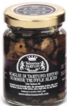
SCAGLIE DI TARTUFO ESTIVO SUMMER TRUFFLE SLICES 80 g / cod. TES80 EAN CODE: 8053629683415