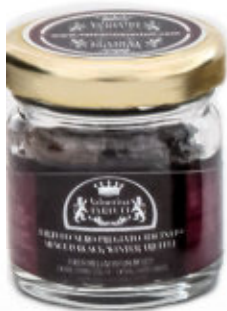
TARTUFO NERO PREGIATO MACINATO MINCED BLACK WINTER TRUFFLE 25 g / cod. TNM25 EAN CODE: 8053629683200