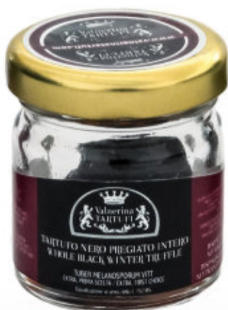
TARTUFO NERO PREGIATO INTERO WHOLE BLACK WINTER TRUFFLE 12,5 g / cod. TNI12.5 EAN CODE: 8053629683019