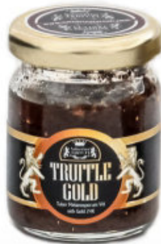
TARTUFO NERO MACINATO CON ORO MINCED BLACK TRUFFLE WITH GOLD 45 g / cod. TNO45 EAN CODE: 8053629681251