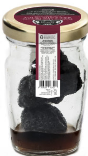
TARTUFO NERO PREGIATO INTERO WHOLE BLACK WINTER TRUFFLE 25 g / cod. TNI25 EAN CODE: 8053629683125