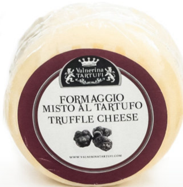
FORMAGGIO MISTO AL TARTUFO TRUFFLE CHEESE 300/400 g / cod. FT1000 EAN CODE: 8053629682401