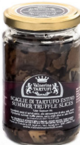
SCAGLIE DI TARTUFO ESTIVO SUMMER TRUFFLE SLICES 250 g / cod. TES250 EAN CODE: 8053629683422