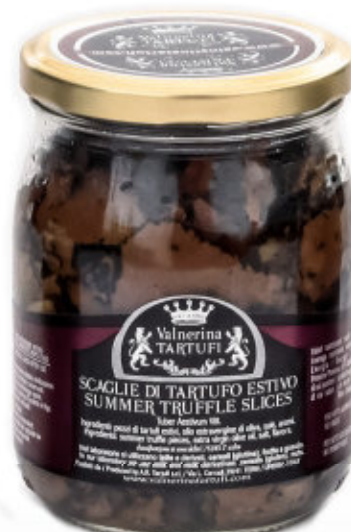
SCAGLIE DI TARTUFO ESTIVO SUMMER TRUFFLE SLICES 450 g / cod. TES450 EAN CODE: 8053629683439