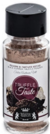
POLVERE DI TARTUFO 50 g TRUFFLE TASTE 50 g cod. TRT50 EAN CODE: 8053629687895