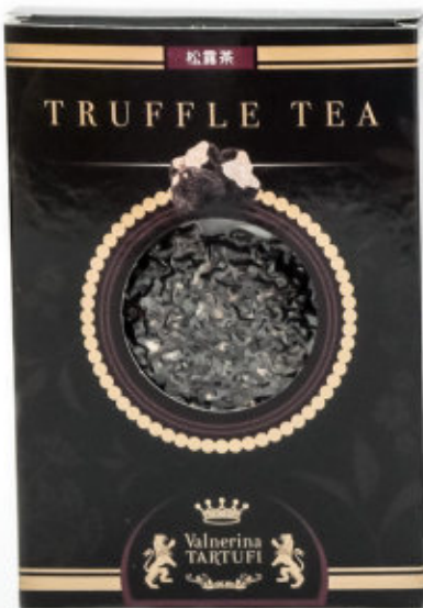
TÈ AL TARTUFO NERO BLACK TRUFFLE TEA 50 g / cod. TTN50 EAN CODE: 8053629681244