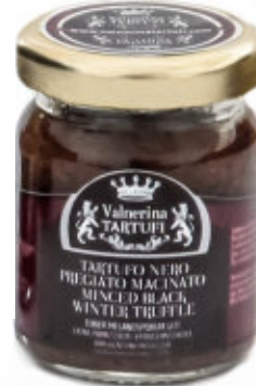
TARTUFO NERO PREGIATO MACINATO MINCED BLACK WINTER TRUFFLE 60 g / cod. TNM60 EAN CODE: 8053629683217