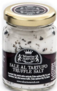
SALE AL TARTUFO 100 g TRUFFLE SALT 100 g cod. SAL100 EAN CODE: 8053629682210