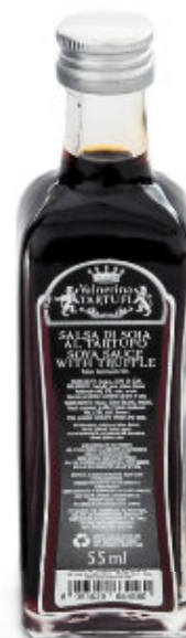
SALSA DI SOIA AL TARTUFO SOY SAUCE WITH TRUFFLE 55 ml / cod. SST55 EAN CODE: 8053629684580