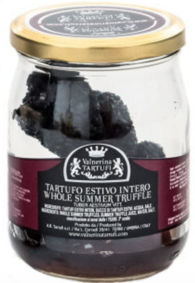
TARTUFO ESTIVO INTERO WHOLE SUMMER TRUFFLE 200 g / cod. TEI200 EAN CODE: 8053629683156