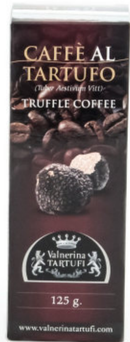
CAFFÈ AL TARTUFO TRUFFLE COFFEE 125 g / cod. CT125 EAN CODE: 8053629682319