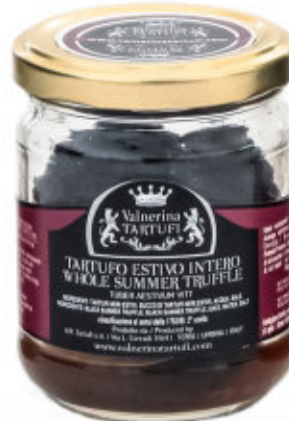
TARTUFO ESTIVO INTERO WHOLE SUMMER TRUFFLE 100 g / cod. TEI100 EAN CODE: 8053629683149