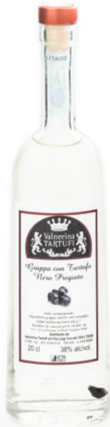
GRAPPA AL TARTUFO NERO BLACK TRUFFLE GRAPPA 20 cl / cod. GT200 EAN CODE: 8053629682289