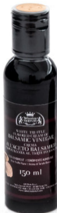
CREMA DI ACETO BALSAMICO AROMATIZZATA AL TARTUFO BIANCO WHITE TRUFFLE FLAVORED CREAM OF BALSAMIC VINEGAR 150 ml / cod. CBTB150 EAN CODE: 8053629682197