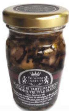
SCAGLIE DI TARTUFO ESTIVO SUMMER TRUFFLE SLICES 60 g / cod. TES60 EAN CODE: 8053629683408