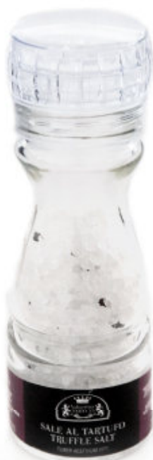
SALE AL TARTUFO 100 g TRUFFLE SALT 100 g cod. SAL100M EAN CODE: 8053629682968