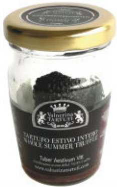
TARTUFO ESTIVO INTERO WHOLE SUMMER TRUFFLE 25 g / cod. TEI25 EAN CODE: 8053629683026