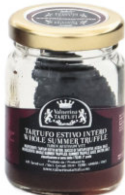
TARTUFO ESTIVO INTERO WHOLE SUMMER TRUFFLE 50 g / cod. TEI50 EAN CODE: 8053629683132