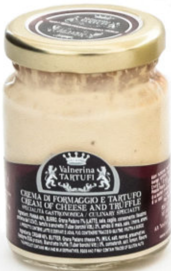
CREMA DI FORMAGGI E TARTUFO CREAM OF CHEESE AND TRUFFLE 80 g / cod. CFT80 EAN CODE: 8053629681619