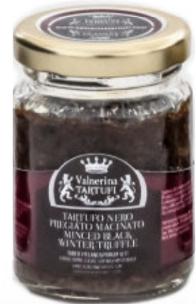
TARTUFO NERO PREGIATO MACINATO MINCED BLACK WINTER TRUFFLE 80 g / cod. TNM80 EAN CODE: 8053629683224