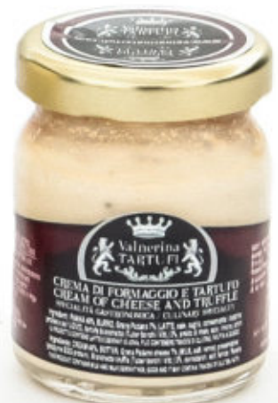
CREMA DI FORMAGGI E TARTUFO CREAM OF CHEESE AND TRUFFLE 45 g / cod. CFT45 EAN CODE: 8053629681633